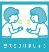
密接を避けましょう