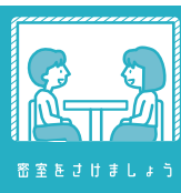
密室を避けましょう