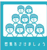
密集を避けましょう