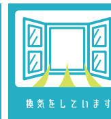
換気をしましょう