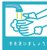
手を洗いましょう