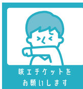
咳エチケットを お願いします